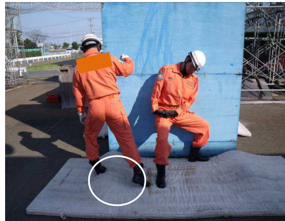
左側の土台上の安全マットに足が掛かり左足を捻った状態