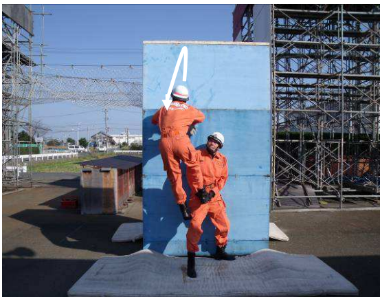
バランスを崩し、左上方向に体が流れた状態