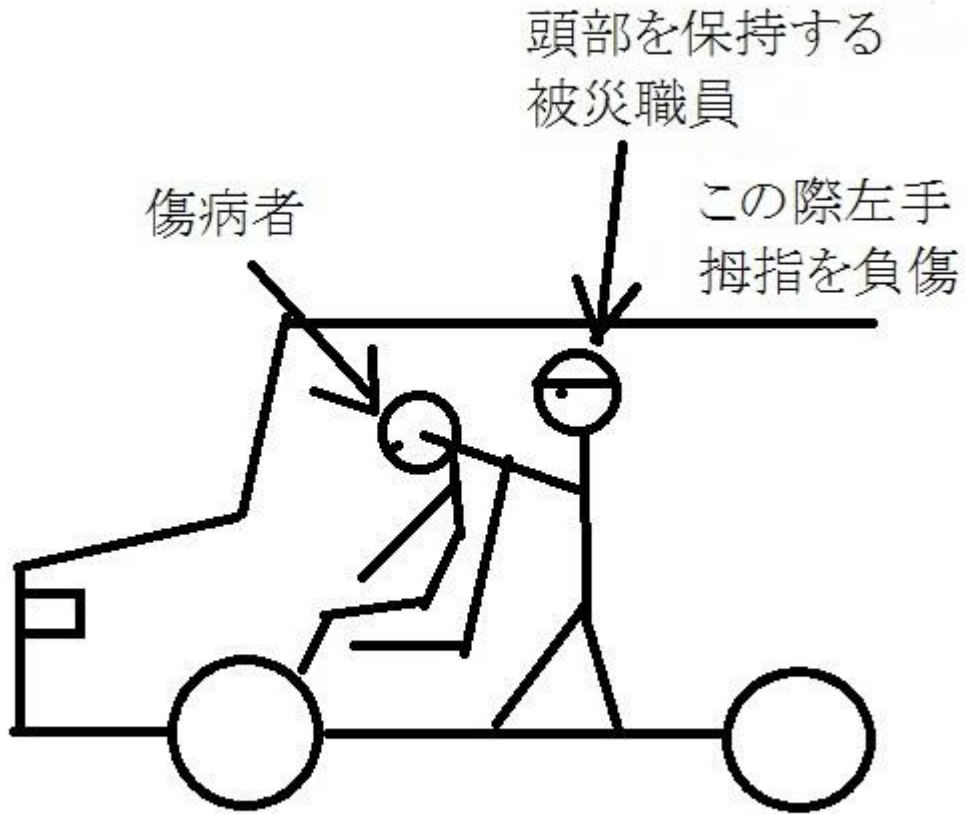
災害発生場所の見取り図