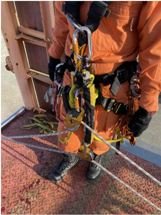
懸垂ロープに下降器及びアサップロックを取りつける