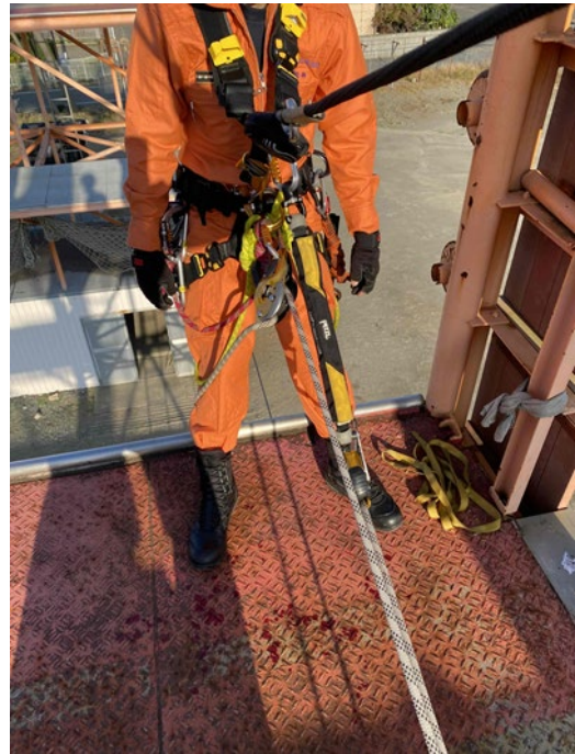
B塔東側より進入準備