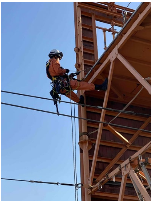
降下体勢をとり、降下準備